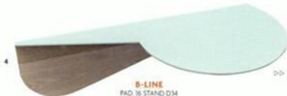
B-LINE PAD. 16 STAND D34

1 - By Trussardi Casa, the Maryl armchair, compact and boldist, designed by Carlo Colombo with the artistic direction of Gaia Trussardi. In leather or fabric, with contrast profiles. • 2 - Architectural dynamism inspired by South America pyramids animate the Mayo armchair by Alessandro La Spada for Clan Milano. • 3 - Ginevra table by Citco Privé, with total white pierced base. • 4 - For B-Line, the Nubila shelf by Elena Salmistraro is made in curved steel laminate and multilayered wood.