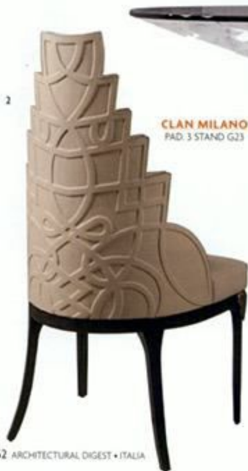
CLAN MILANO PAD. 3 STAND G23